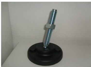
HASTE EM FERRO ZINCADO