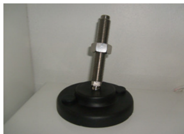
HASTE EM AÇO-INOX-304