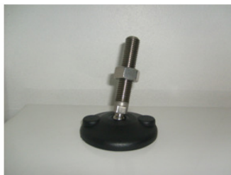
HASTE EM AÇO-INOX-304