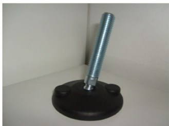
HASTE EM FERRO ZINCADO