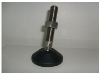
HASTE EM AÇO-INOX-304