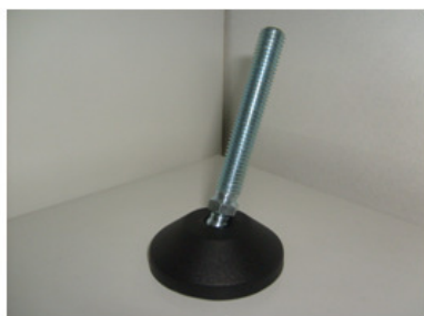
HASTE EM FERRO ZINCADO